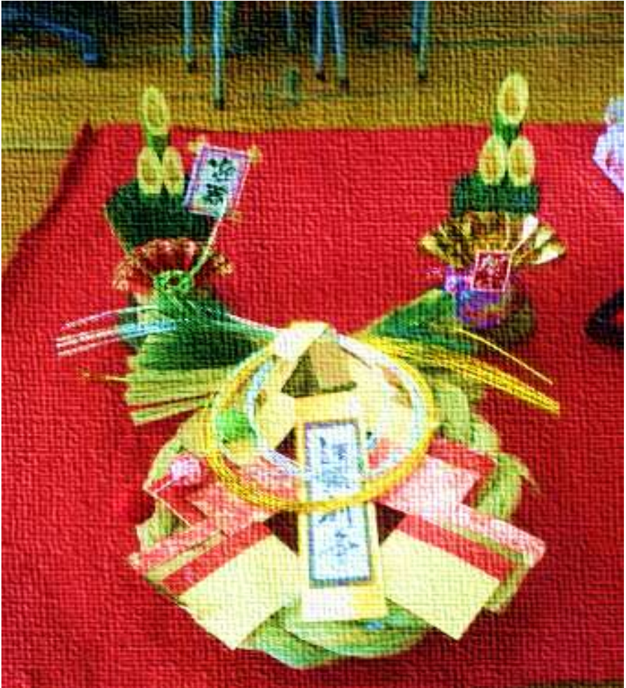
2015/12/21 お正月飾り @ウエンディ本部