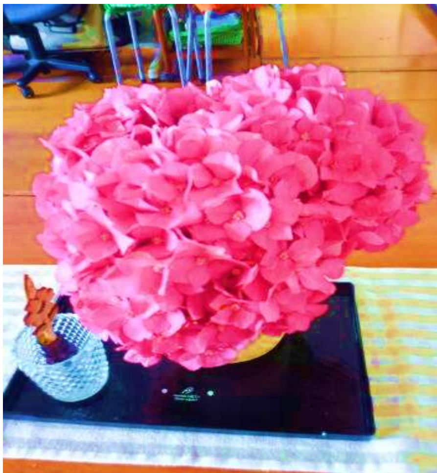
2016/6/15 レイコさんちの紫陽花@ウエンディ本部