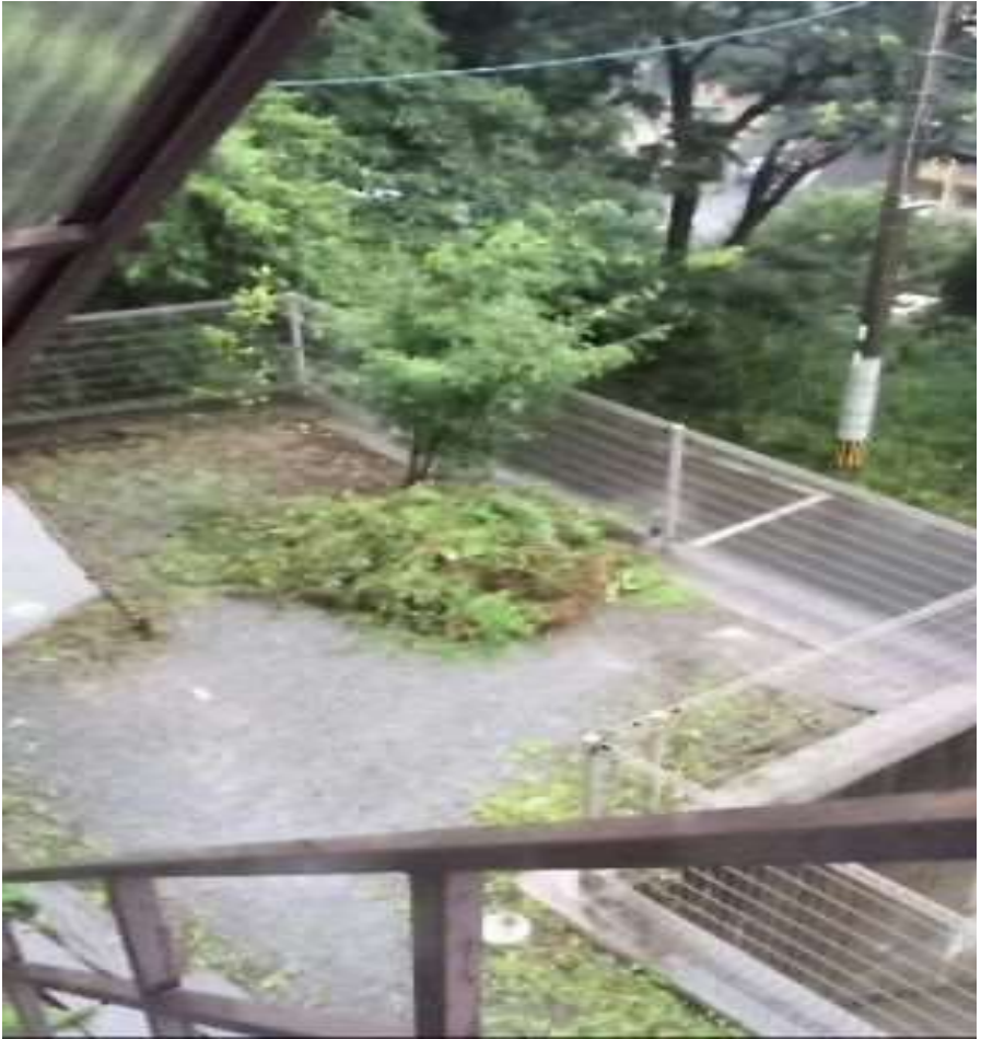
2014/8/4 梅雨本番中@ウエンディ本部